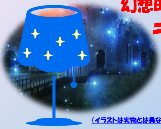
(イラストは実物とは異なります)

申込期間：5月30日(月)～6月6日(月) 申込方法：申込書(本紙下方)に必要事項をご記入の上、 郵送またはFAXにてお申込みください