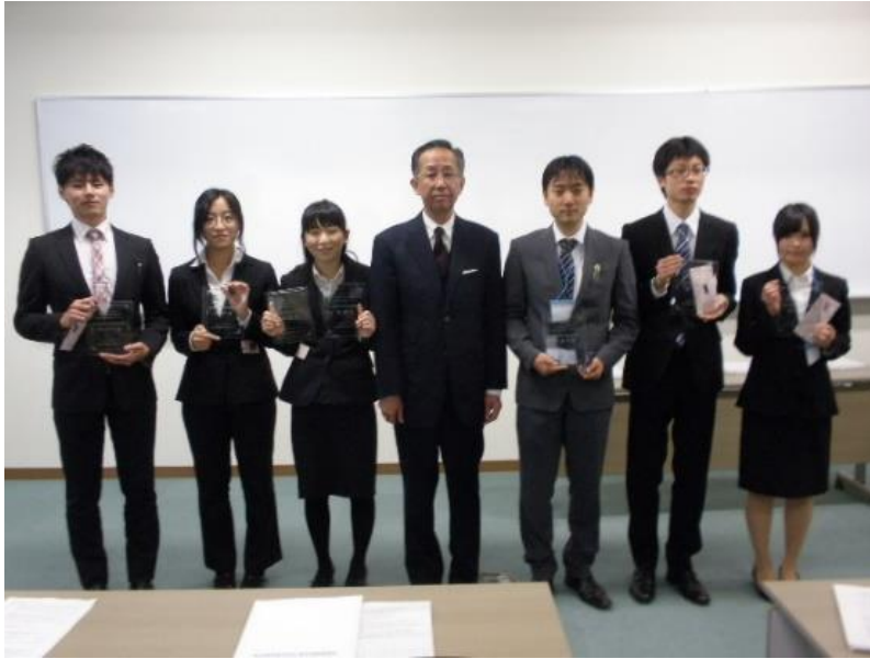
振興会会長と受賞者6名