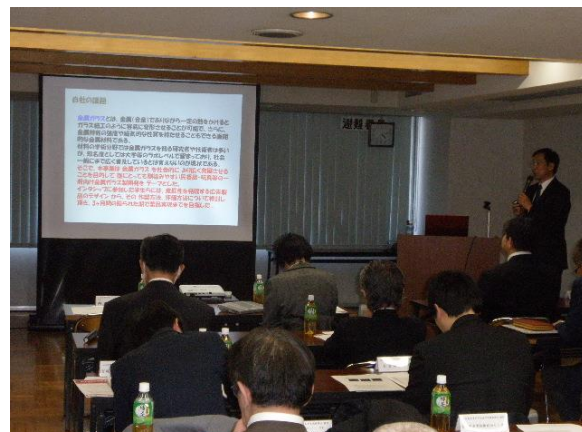
企業事例発表 (株式会社真壁技研 真壁様)