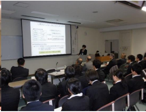
ショートプレゼンテーションの様子