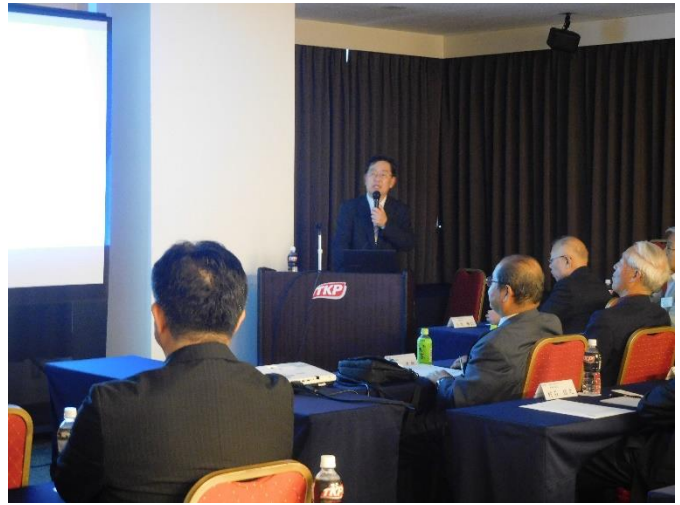
2 教員研究発表(ショートプレゼンテーション)