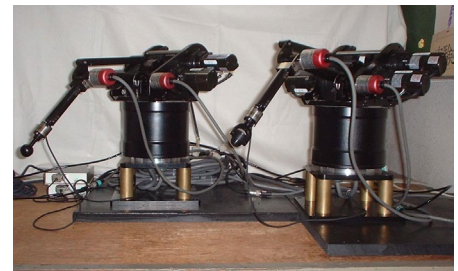
図 2. バイラテラルロボットシステム