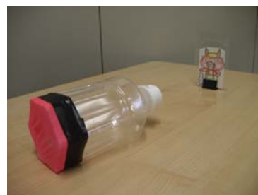
最後はペットボトル砲