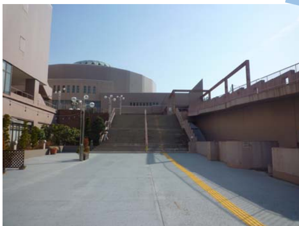
5. 左に曲がり階段を上る