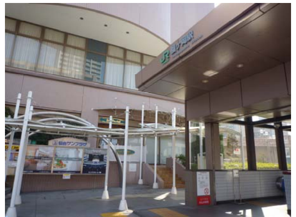
2. JR 榴ヶ岡駅 出入口