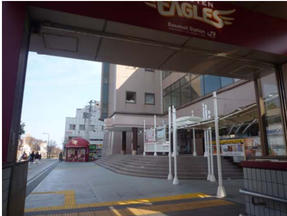
1. JR 榴ヶ岡駅 出入口