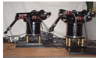
図 2. バイラテラルロボットシステム