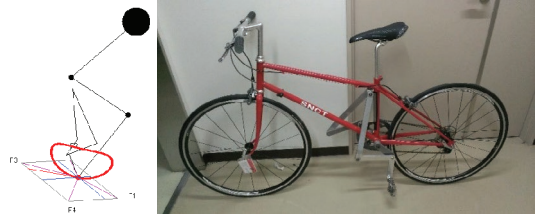
図 1 スポーツ用試作 3 号機のペダリング軌跡と外観