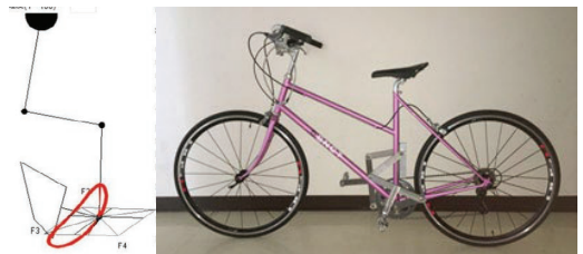
図 2 一般用試作 3 号機のペダリング軌跡と外観