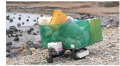
株式会社石井製作所との海ごみ自動運搬ロボット