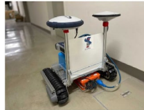
開発中の自動走行地中レーダ

道路や床版の異常箇所検出などのインフラ点検 水道管・ガス管検出などの建設工事分野 大規模災害時の行方不明者捜索の災害分野 海岸漂着ごみの回収などの環境分野 遺跡探査など考古学分野 農作物の生育調査などの農林水産分野