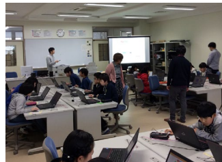
児童向け教育アプリケーションの評価